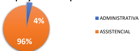
Proporção das Despesas